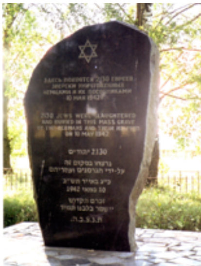
Памятник евреям г. п. Радунь – жертвам Холокоста.