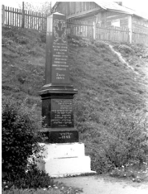
Памятник на улице Мельникайте на месте расстрела 2 марта 1942 г. узников Минского гетто. 1946 г.