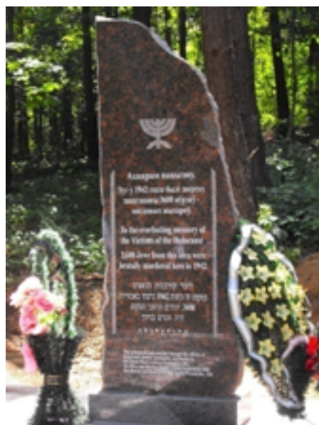
Памятники на месте уничтожения евреев в д. Молчадь.