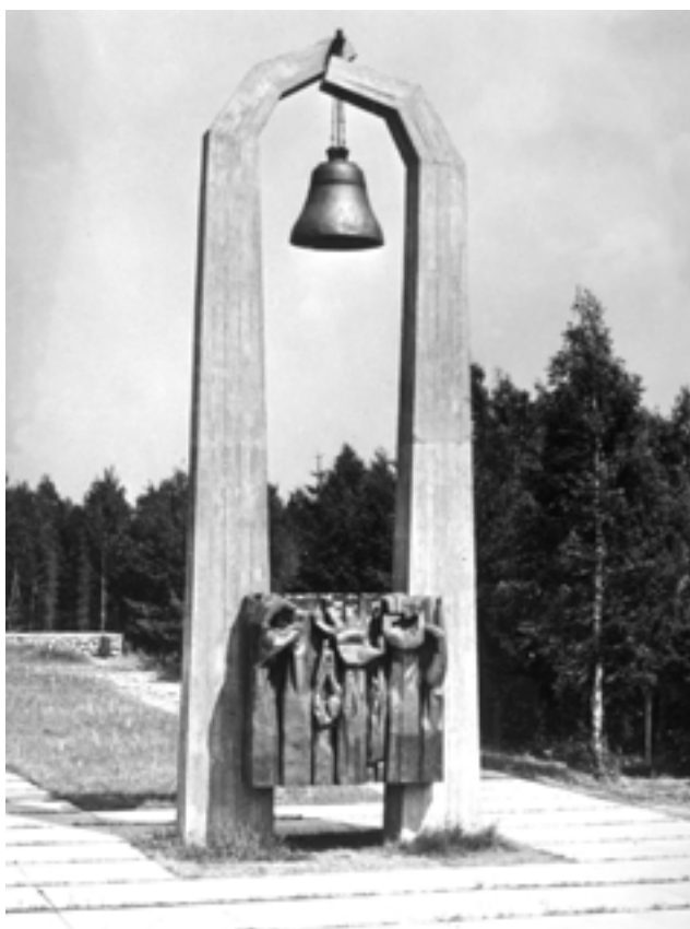
Памятник мирным чехословацким гражданам, уничтоженным оккупантами в урочище Гай возле г. Барановичи. 1971 г.