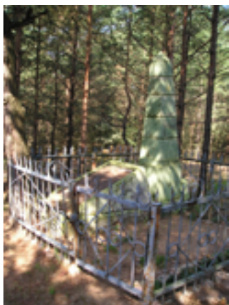
Памятник на братской могиле уничтоженных евреев гетто в д. Давыдовка.