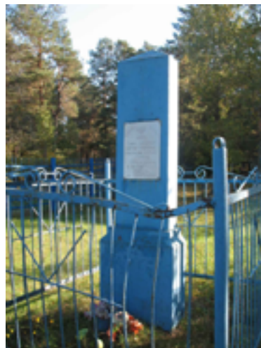
Памятник на еврейском кладбище в г. Гомеле на братской могиле евреев, погибших в 1941–1943 гг.