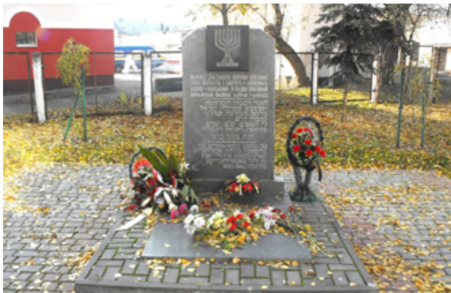
Памятник узникам гетто в г. Бресте.