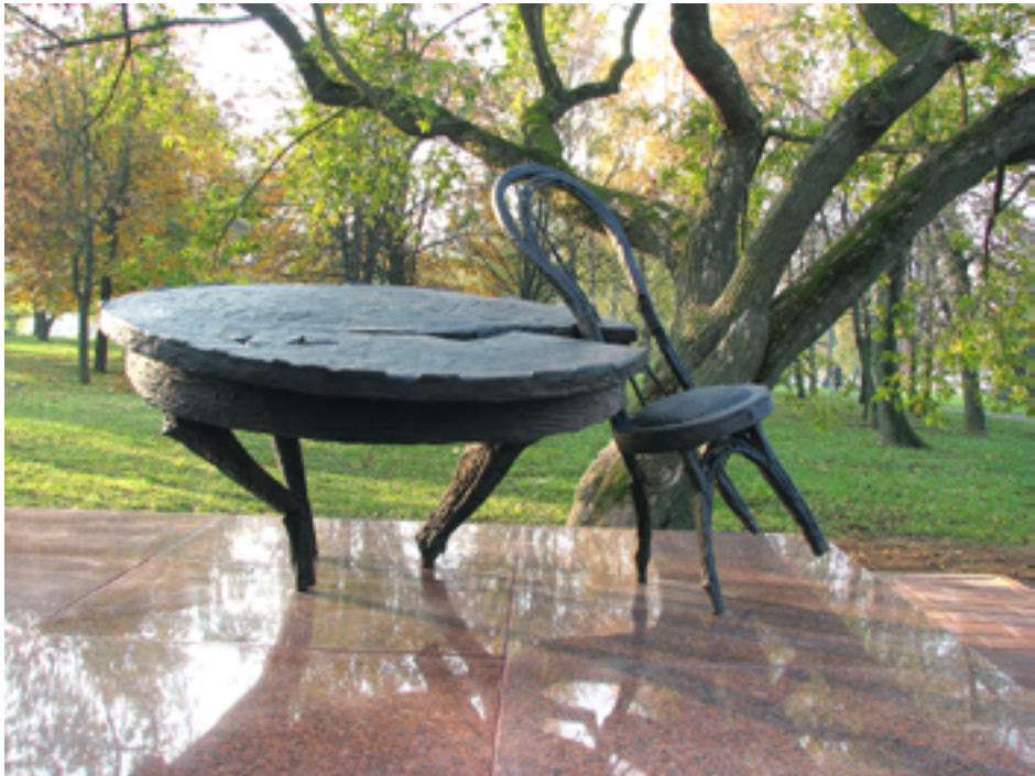
Мемориал-памятник узникам Минского гетто «Разбитый очаг» на улице Сухая. 2008 г.