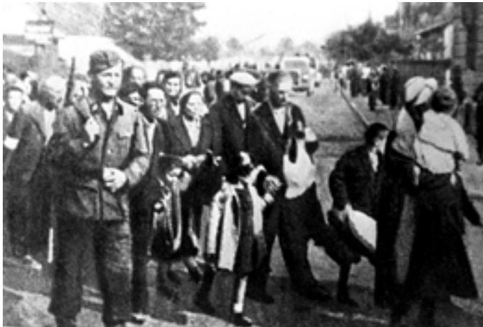
Немецкие солдаты ведут узников Гродненского гетто к месту расстрела в районе д. Лососно. 1942 г.