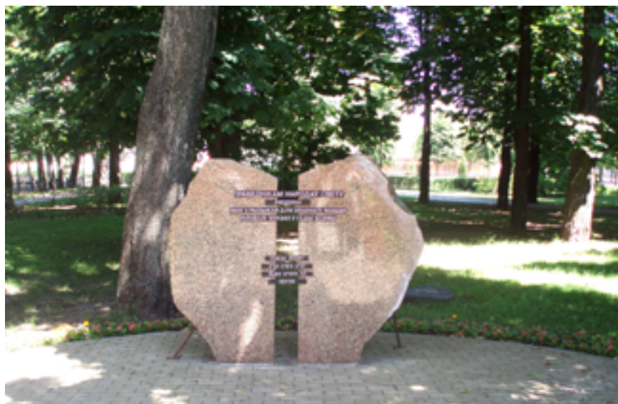
Памятник Праведникам народов мира в г. Бобруйске.