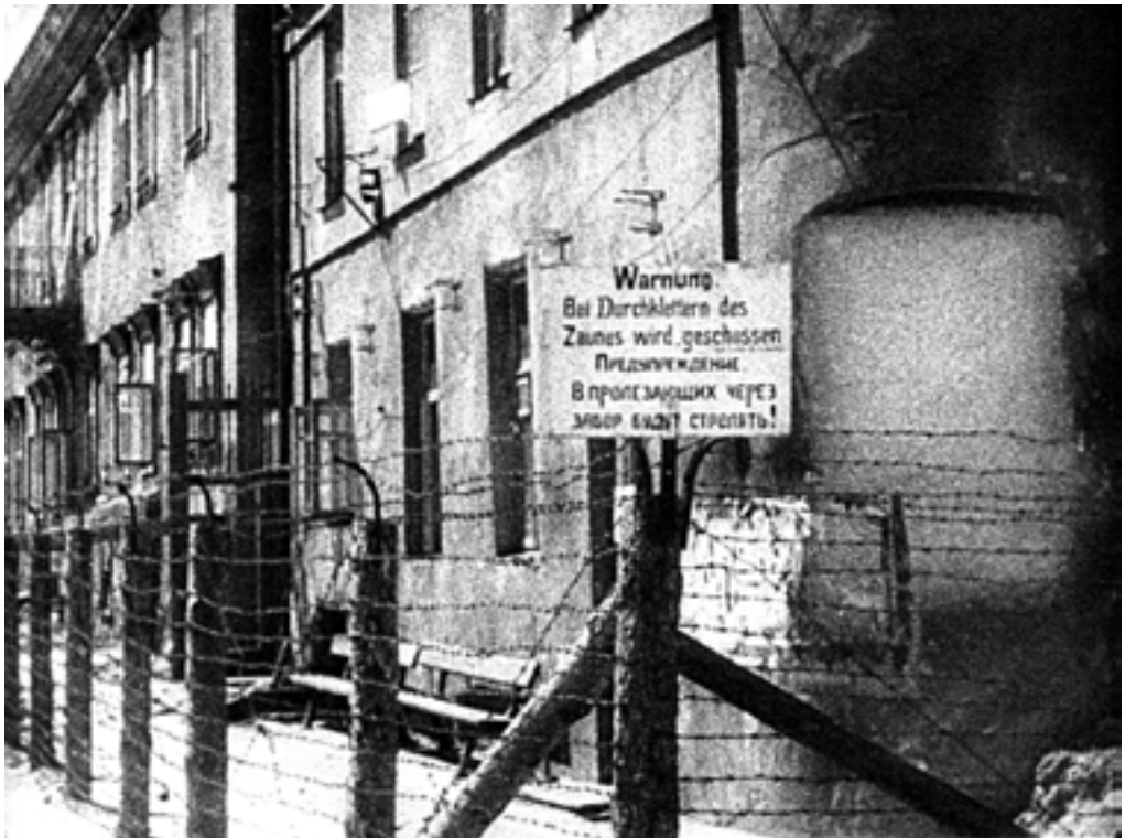
Вывеска с предупреждающей надписью на территории Минского гетто.