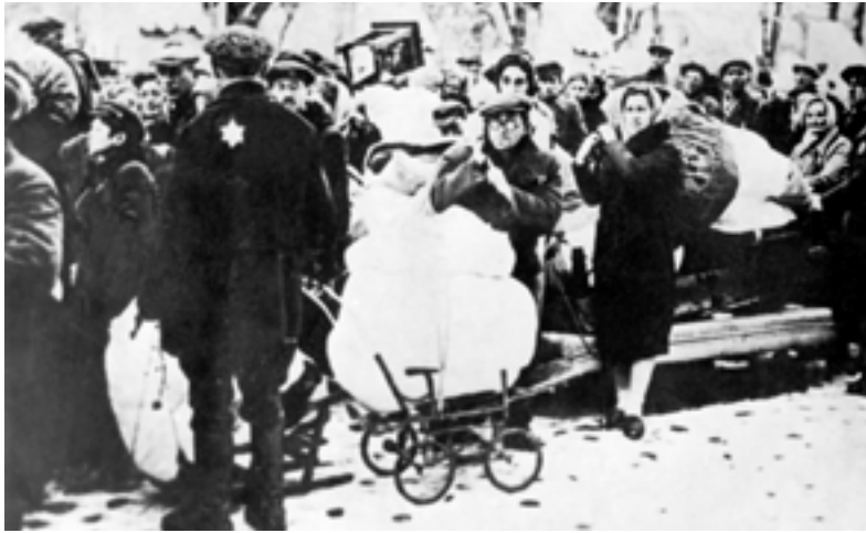
Еврейское население г. Гродно перед отправкой в гетто. 1941 г.