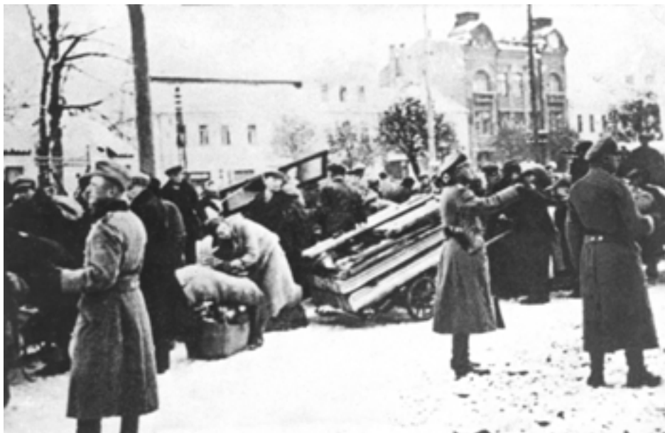
У ворот гетто по улице Замковой в г. Гродно. 1941 г.