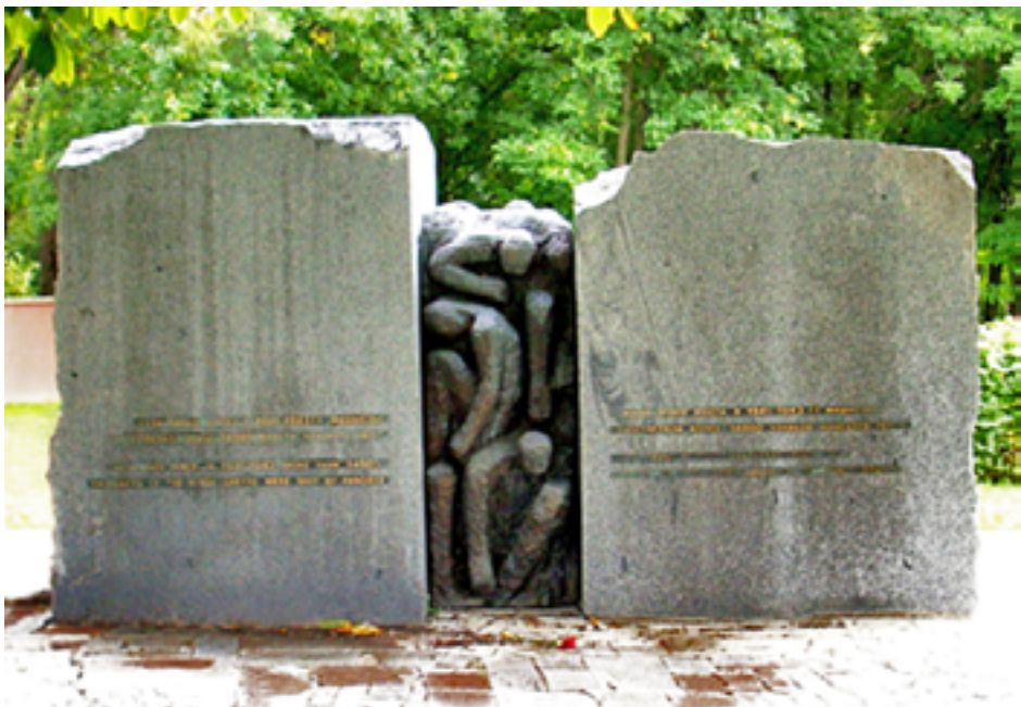
Памятник 14 000 евреям — узникам Минского гетто, убитым в Тучинке. 2008 г.