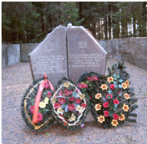
Памятник на месте расстрела узников Зембинского гетто.