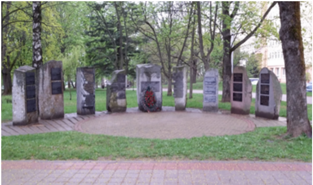
Памятник на улице Сухая евреям, депортированным из стран Европы и уничтоженным в Минском гетто и лагере смерти Тростенец.