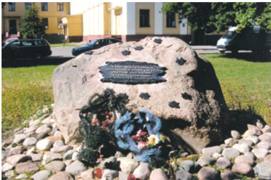
Памятный знак на месте Барановичского гетто. 2009 г.