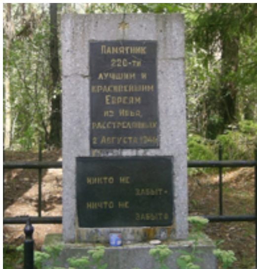
Памятник на месте уничтожения евреев в 1941 г. у д. Стоневичи. Фрагмент Мемориального комплекса в память ивьевских евреев – жертв Катастрофы.