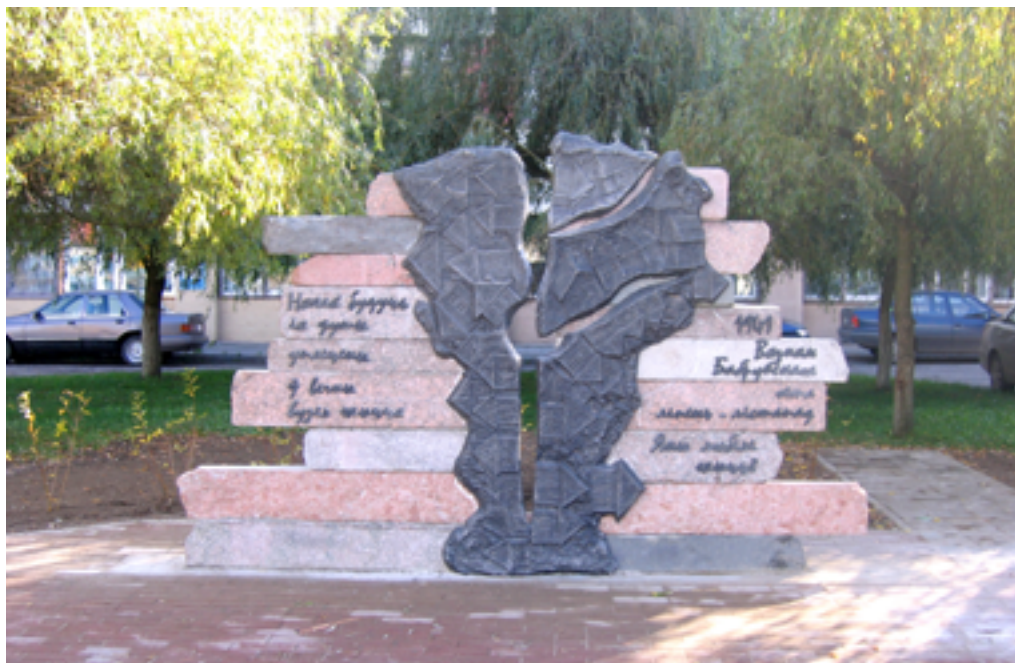
Мемориальный знак «Узникам Бобруйского гетто».