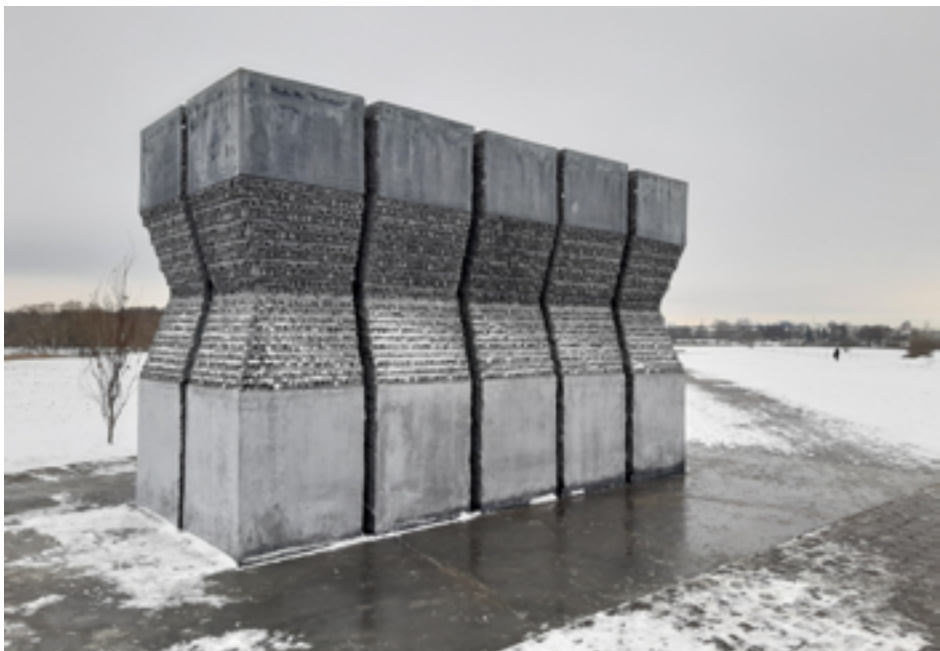
Памятник «Массив имен» в мемориальном комплексе «Тростенец». 2019 г.