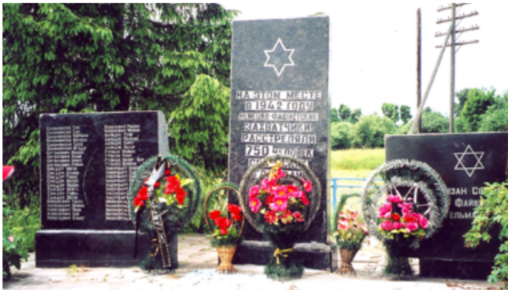
Памятник расстрелянным узникам гетто в д. Илья.