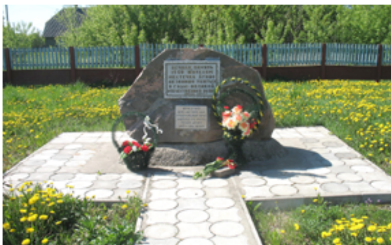
Памятник узникам гетто в д. Лунно.