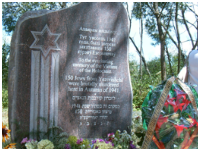
Памятник уничтоженным евреям в г. п. Езерище. 2007 г.