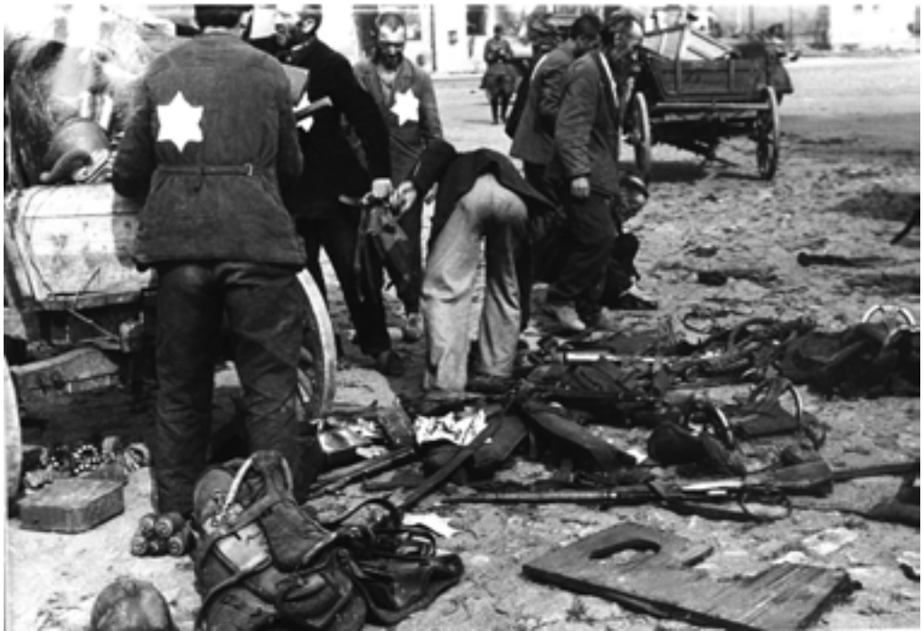
Евреи Могилевского гетто за погрузкой немецкой амуниции на возы. 1941 г.