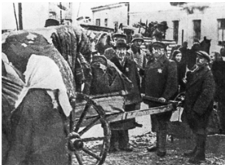
Переселение жителей г. Гродно в гетто. 1941 г.