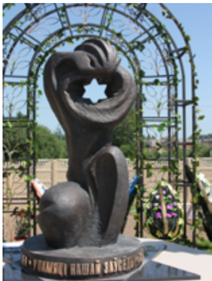
Памятный знак в Иловском (Туловском) овраге — на месте массового уничтожения узников Витебского гетто.