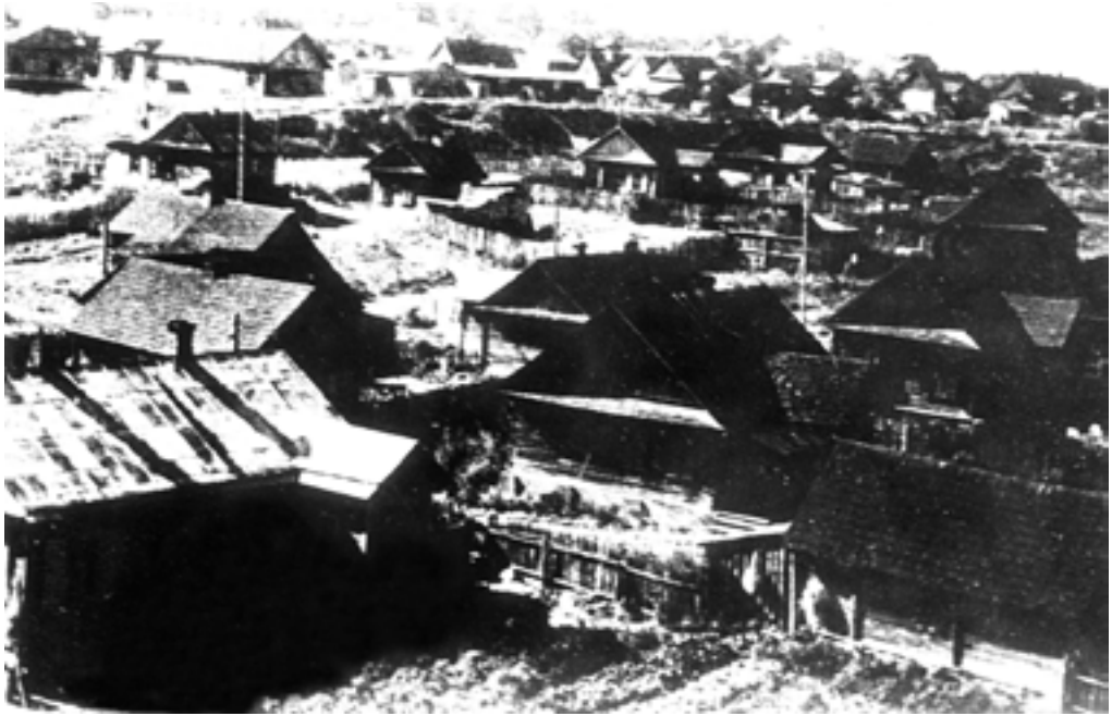
Вид на гетто в г. Минске.