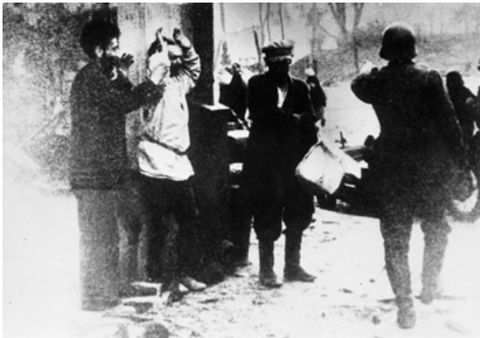
Немецкие солдаты арестовывают мирных жителей г. Витебска. 1941 г.