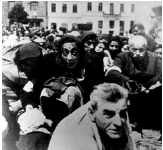
Во время переселения евреев г. Минска в гет- то. 1941 г.