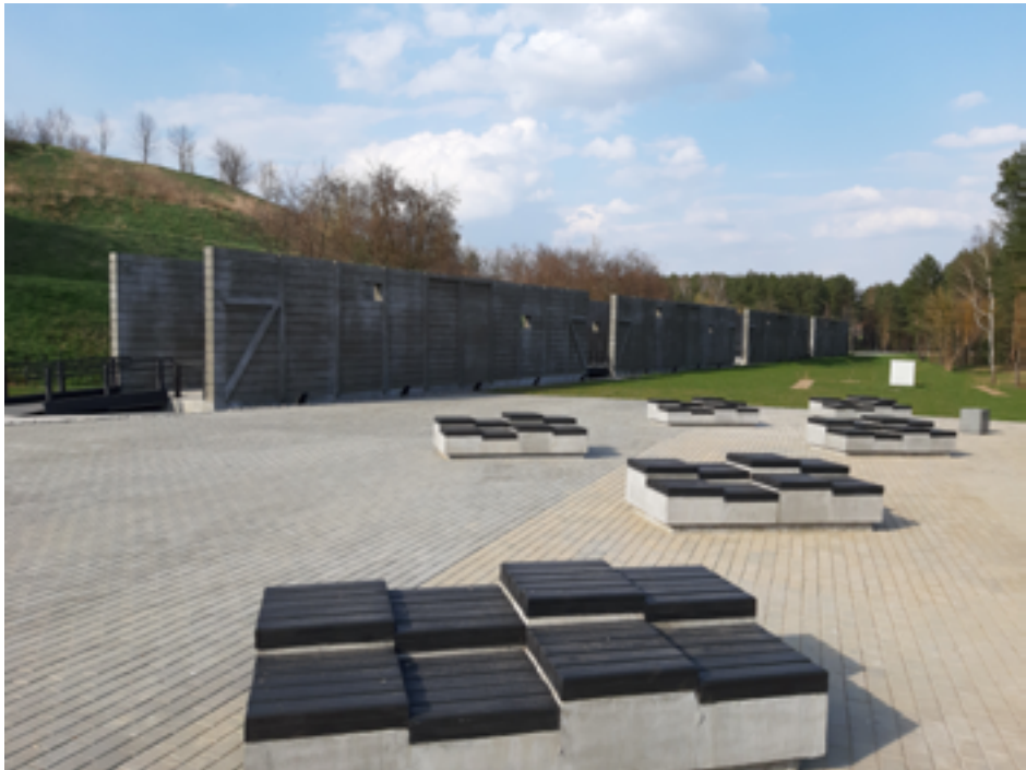
Мемориальный комплекс «Благовещина». 2018 г.