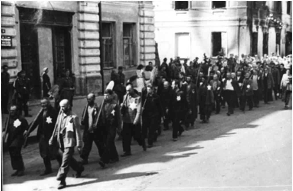
Еврейское население г. Могилева идет на работу с шанцевым инструментом. 1941 г.