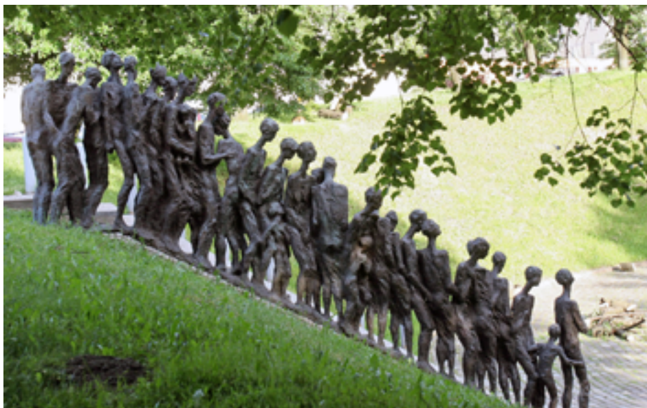
Скульптурная композиция «Последний путь» мемориального комплекса «Яма. Минское гетто». 2008 г.