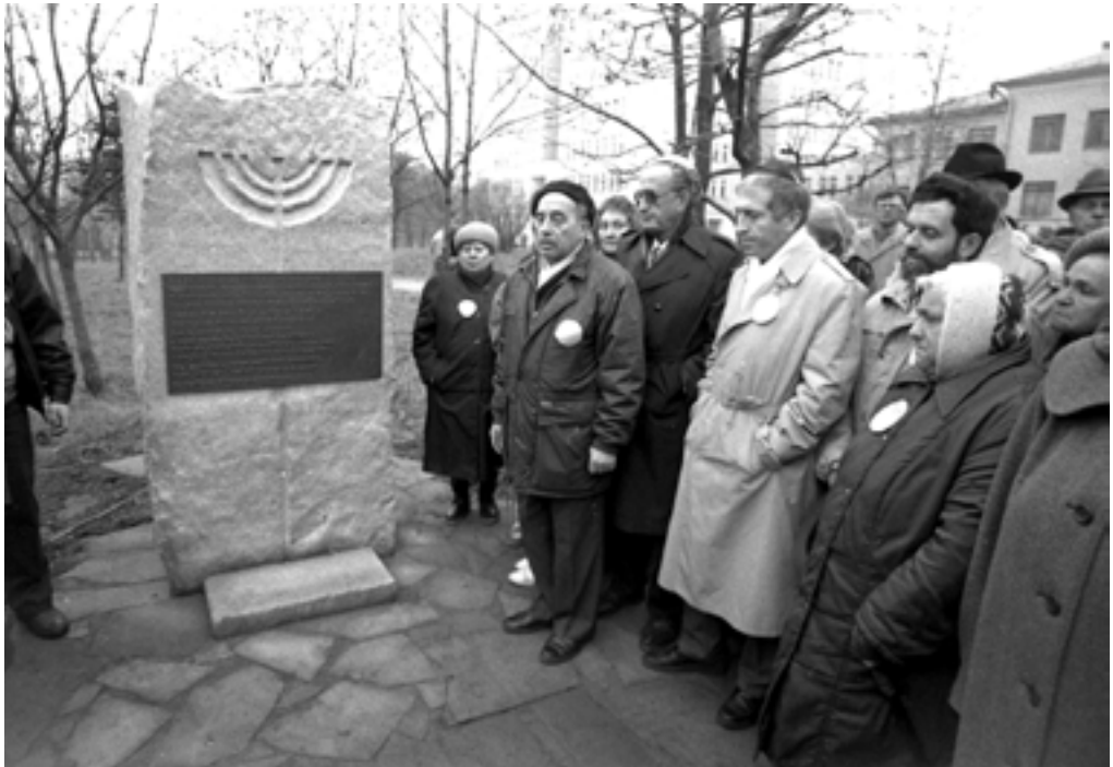
Открытие мемориального знака в память о депортированных и уничтоженных евреях из г. Гамбурга. 1993 г. БГАКФФД