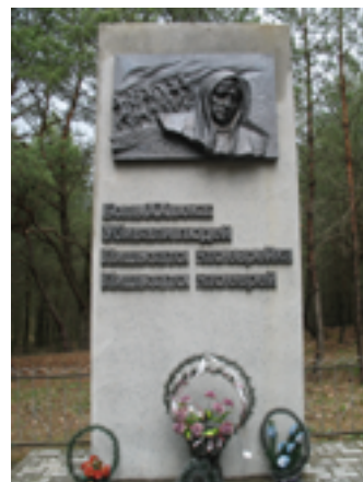
Памятник на месте гибели евреев гетто в д. Давыдовка. 2005 г.