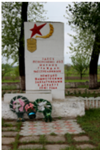
Обелиск на месте захоронения 483 евреев – жителей г. Буда- Кошелево, расстрелянных оккупантами в декабре 1941 г. 2014 г.