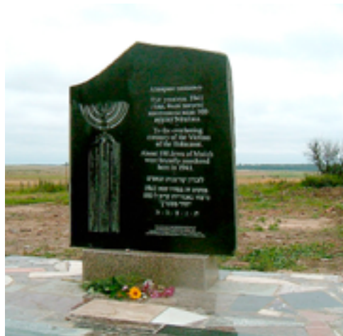
Памятник уничтоженным в 1941 г. евреям в д. Мстиж.